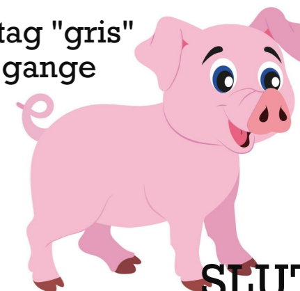
gentag "gris" 5 gange