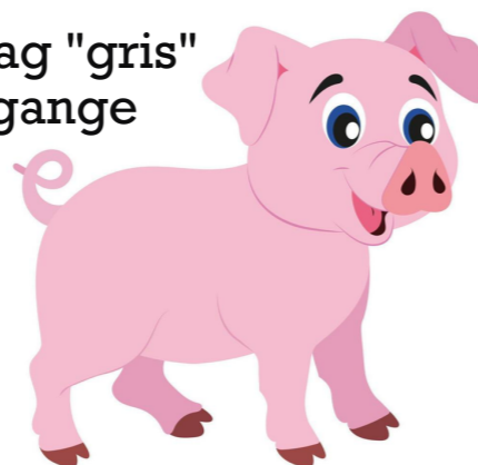
gentag "gris" 5 gange