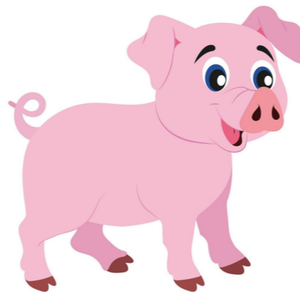
gentag "gris" 5 gange